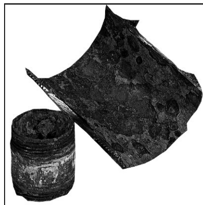
Korrosionen an Rohrleitungen